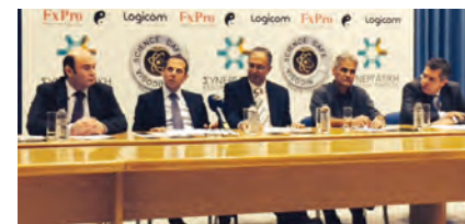
ΣΥΝΕΡΓΑΤΙΚΗ ΚΕΝΤΡΙΚΗ ΤΡΑΠΕΖΑ

τομικευμένων υπηρεσιών, που μπορούν να προσφερθούν τόσο στους εταιρικούς πελάτες, όσο και σε μεμονωμένους εταιρικούς ταξιδιώτες σε όλα τα στάδια του ταξιδιού τους, ενισχύοντας τόσο το κομμάτι των επαγγελματικών ταξιδιών, όσο και τη συνολική ταξιδιωτική εμπειρία.