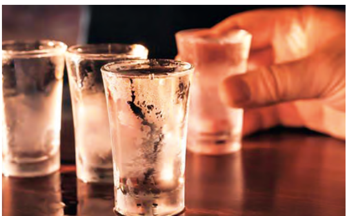
Photo of the day // Ζιβανία