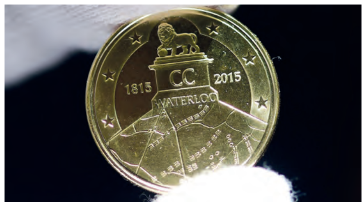
Photo of the week // Εντάσεις για νόμισμα του Βατερλώ