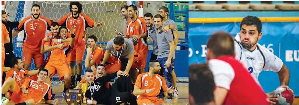
Άλλο παιχνίδι ο Προοδευτικός θα υποδεχθεί τον Παρνασσό.

Η 2η αγωνιστική έχει ήδη οριστεί για το Σάββατο 8/4/2017 με το μεγάλο ντέρμπι ανάμεσα σε Α.Σ.Σ.Σ.Π.Ε.Σ. και Ευρωπαϊκό να δεσπόζει των αναμετρήσεων, ενώ στο