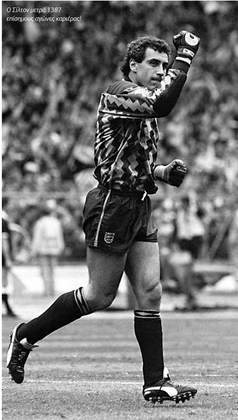
Ο Σίλτον μετρά 1387 επίσημους αγώνες καριέρας!

Ο Τοσάβι βρίσκεται αυτήν τη στιγμή στην 9η θέση της λίστας, ο Κασίγιας στη 15η, ο Μπουφόν στη 18η και ο Σίμονς στην 23η. Και οι τέσσερις μόνο μπροστά μπορούν να βλέπουν, αφού όσοι βρίσκονται πιο πάνω στη λίστα, έχουν ήδη τερματίσει την καριέρα τους. Φυσιολογικά, ο μόνος Τσένι, αν συνεχίσει την καριέρα του στη σεζόν 2017-18, ίσως βρεθεί μέχρι και στην πρώτη εξάδα, οι δε Κασίγιας και Μπουφόν στην πρώτη δεκάδα. Πάντως, αν ριζούμε μια ματιά στη λίστα των 25 θα διαπιστώσουμε ότι οι περισσότεροι είναι τερματοφύλακες (9) κι ακολουθούν οι αμυντικοί (7), οι μέσοι (7) και οι επιθετικοί (2). Όσο για την πρώτη εξάδα, τη μερίδα του λέοντος έχουν οι τερματοφύλακες (4). Λογικό, αφού η ανθεκτικότητα και το προσδόκιμο ποδοσφαιρικής ζωής είναι πολύ πιο μεγάλο ανάμεσα στους