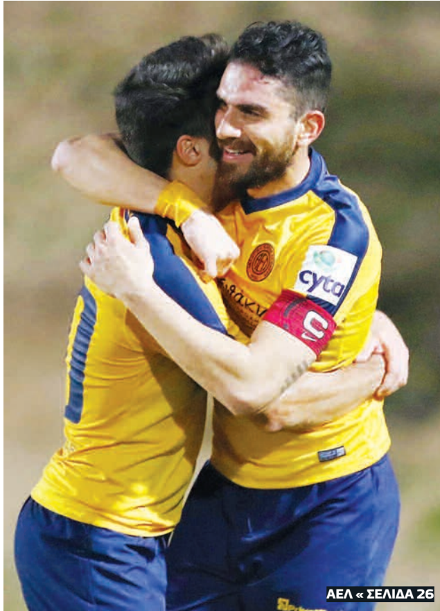
ΑΕΛ « ΣΕΛΙΔΑ 26