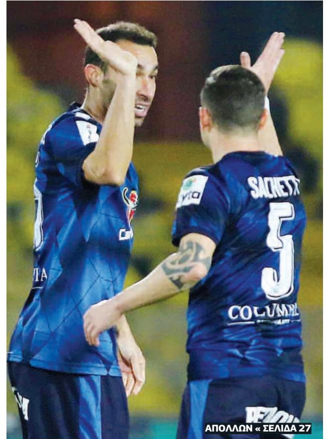
ΑΠΟΛΛΩΝ « ΣΕΛΙΔΑ 27