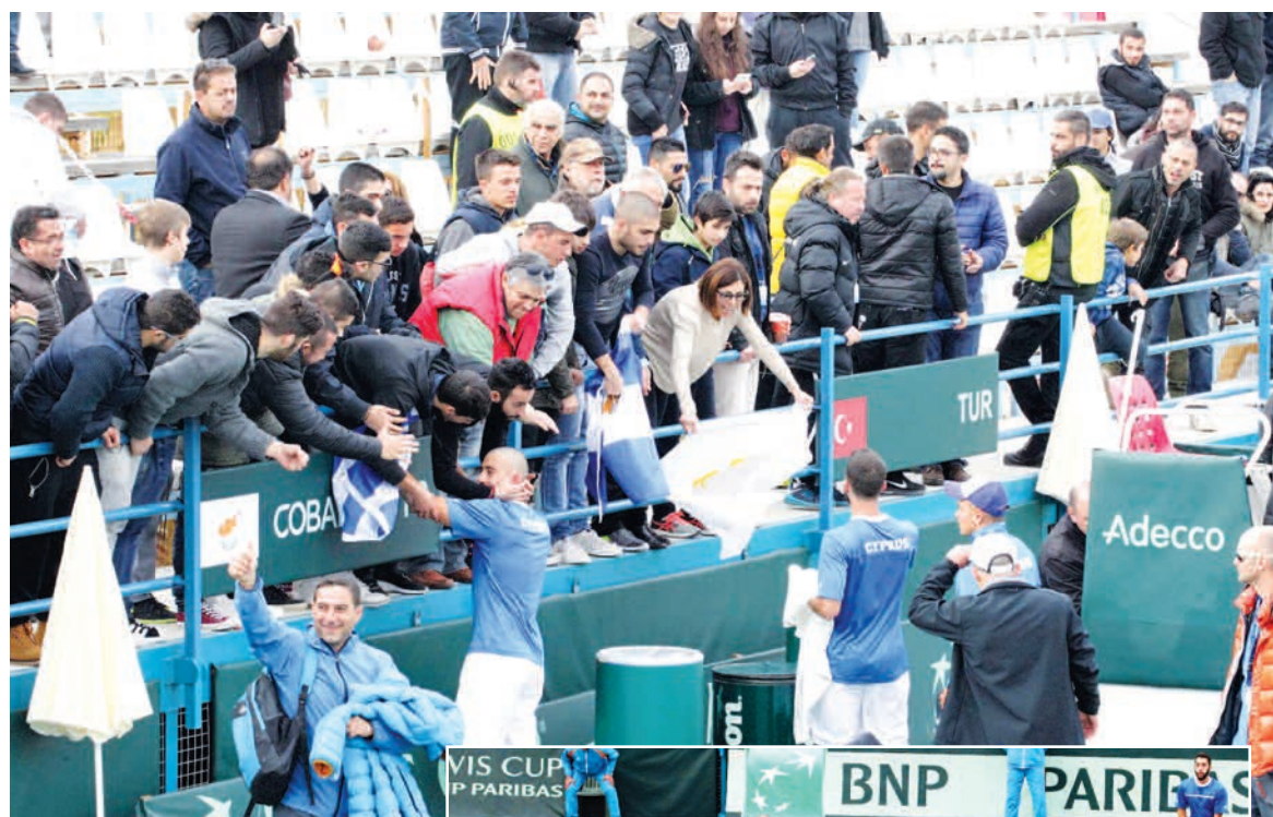
Τσεμ Ιλκέλ (Tur) 3-2 (3-6, 5-7, 7-6[3], 6-4, 6-1)