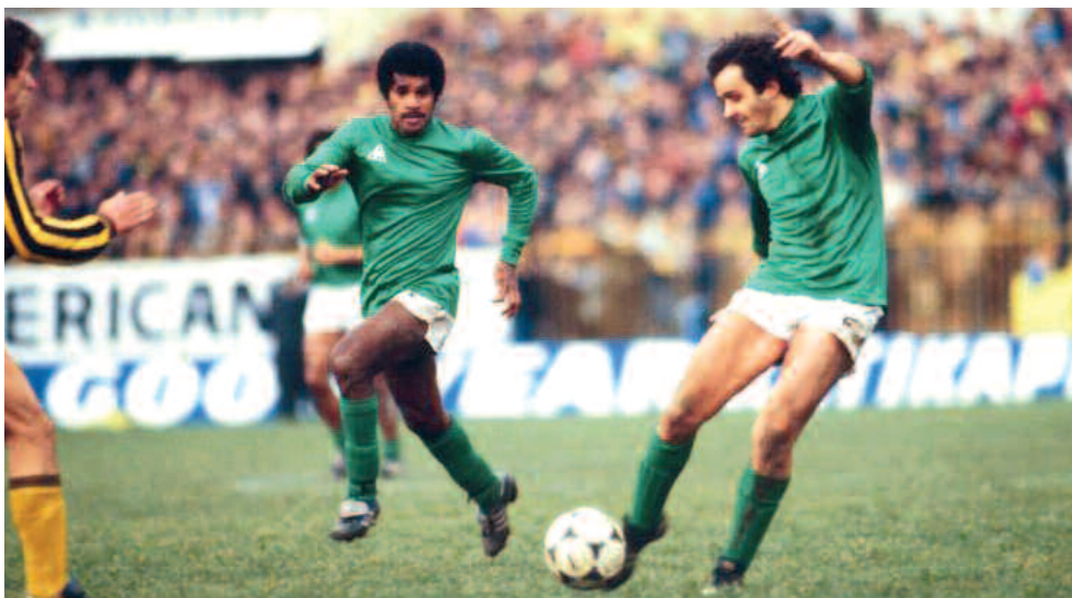
Ο Πλατινί στα 1990 με τη φανέλα της Σεντ Ετιέν.

Η Βέρντερ Βρέμης δεν έχει φυσικά την αίγλη των περισσότερο ομάδων του ρεπορτάζ, αλλά από τα μέσα της δεκαετίας του '80 έγινε και έμεινε μία ομάδα 1ης γραμμής. Πήρε πρωταθλήματα (3), διεκδίκησε μέχρι τέλους άλλα 7, κατέκτησε πέντε κύπελλα, σήκωσε το Κύπελλο Κυπελλούχων, έκανε αξιόλογες παρουσίες στο Τσάμπιονς Λιγκ.