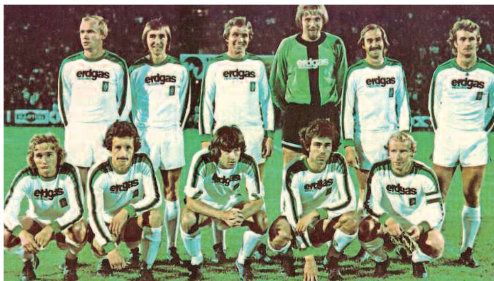
Η μεγάλη Γκλάντμπαχ στα μέσα της δεκαετίας του '70.