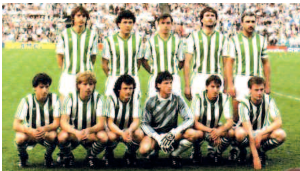
Η Ραπίντ, φιναλίστ στον τελικό του Κυπέλλου Κυπελλούχων το 1985.

Έχει όμως χρόνια να πάρει τίτλο και την τελευταία πενταετία έχει γίνει, από ομάδα της 1ης γραμμής, ένα συγκρότημα μετρίων δυνατοτήτων, που πασικίζει να κρατηθεί στην 1η κατηγορία.