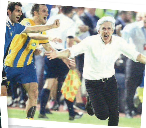
Τέσσερις τίτλους και ευρωπαϊκές επιτυχίες έχει ο Ιβάν Γιοβάνοβιτς με τον ΑΠΟΕΛ, που εδώ πανηγυρίζει έντονα.