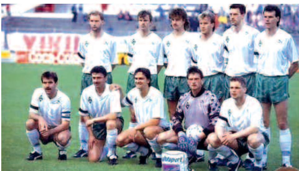
Η Βέρντερ του Ότο Ρεχάγκελ, Κυπελλούχος Ευρώπης στα 1992.