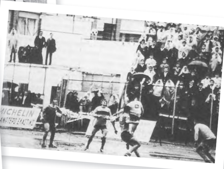
Το ντέρμπι του 1971 διεκόπη λόγω βροχών στο 43'. Η φωτογραφία είναι ενδεικτική της ακαταλληλότητας του γηπέδου.