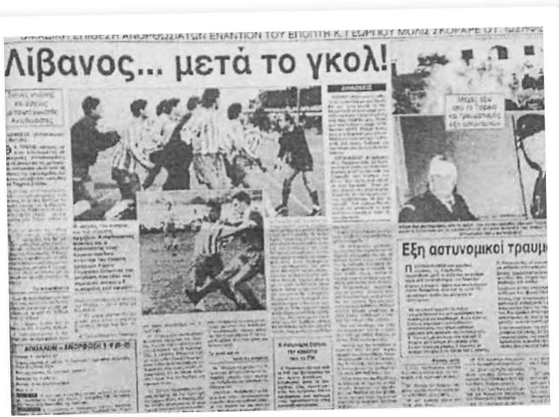
Δημοσίευμα για τη διακοπή του αγώνα Απόλλωνα-Ανόρθωσης στο «Τσίρειο».

Σ.Σ. Θυμάμαι πως για ένα χρονικό διάστημα έκανα περιγραφή αγώνων της Ανόρθωσης στο «Αντώνης Παπαδόπουλος» ανάμεσα στους φιλάθλους και βρέθηκα στο στόχαστρο κάποιων νεαρών οπαδών της, όχι ως άτομο, αλλά ως εκπρόσωπος του «Ράδιο Πρώτο». Έτσι ήταν το κλίμα της τότε εποχής.