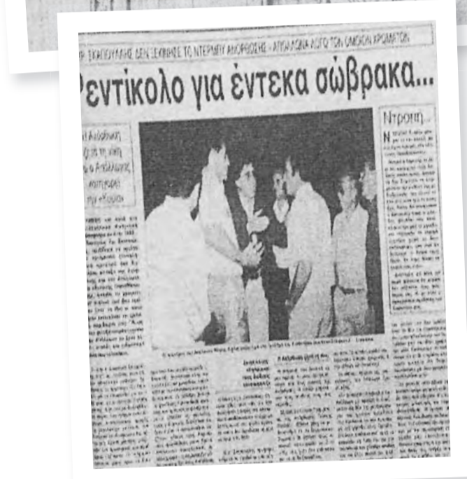
Δημοσίευμα του Τύπου για τα σώβρακα...