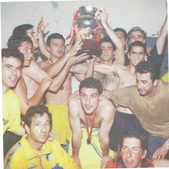
Πανηγυρισμοί των παικτών του ΑΠΟΕΛ με το τρόπαιο.

ΑΠΟΕΛ - Ανόρθωση ..... 2 - 0 Μοράις 53', Μιροσάβλιεβις 75'