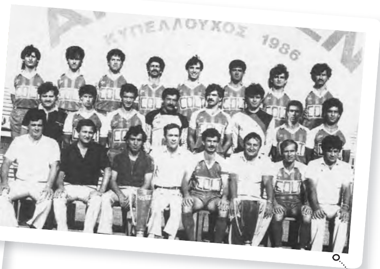
Ο Απόλλωνας που κέρδισε το κύπελλο το 1986, νικώντας τον ΑΠΟΕΛ 2-0.