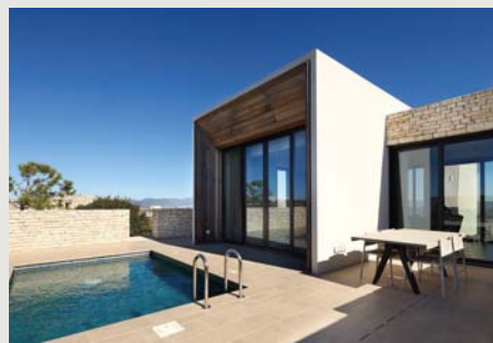
VILLAS | 2&3 BEDS Villas from €1,145,000 +VAT