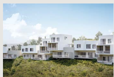
SUITES | 2 BEDS Suites from €800,000 +VAT

To book an appointment, virtual tour or live property viewing please contact us on +357 26 848 800, info@pafilia.com