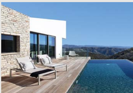
RESIDENCES | 3&4 BEDS Residences from €1,795,000 +VAT