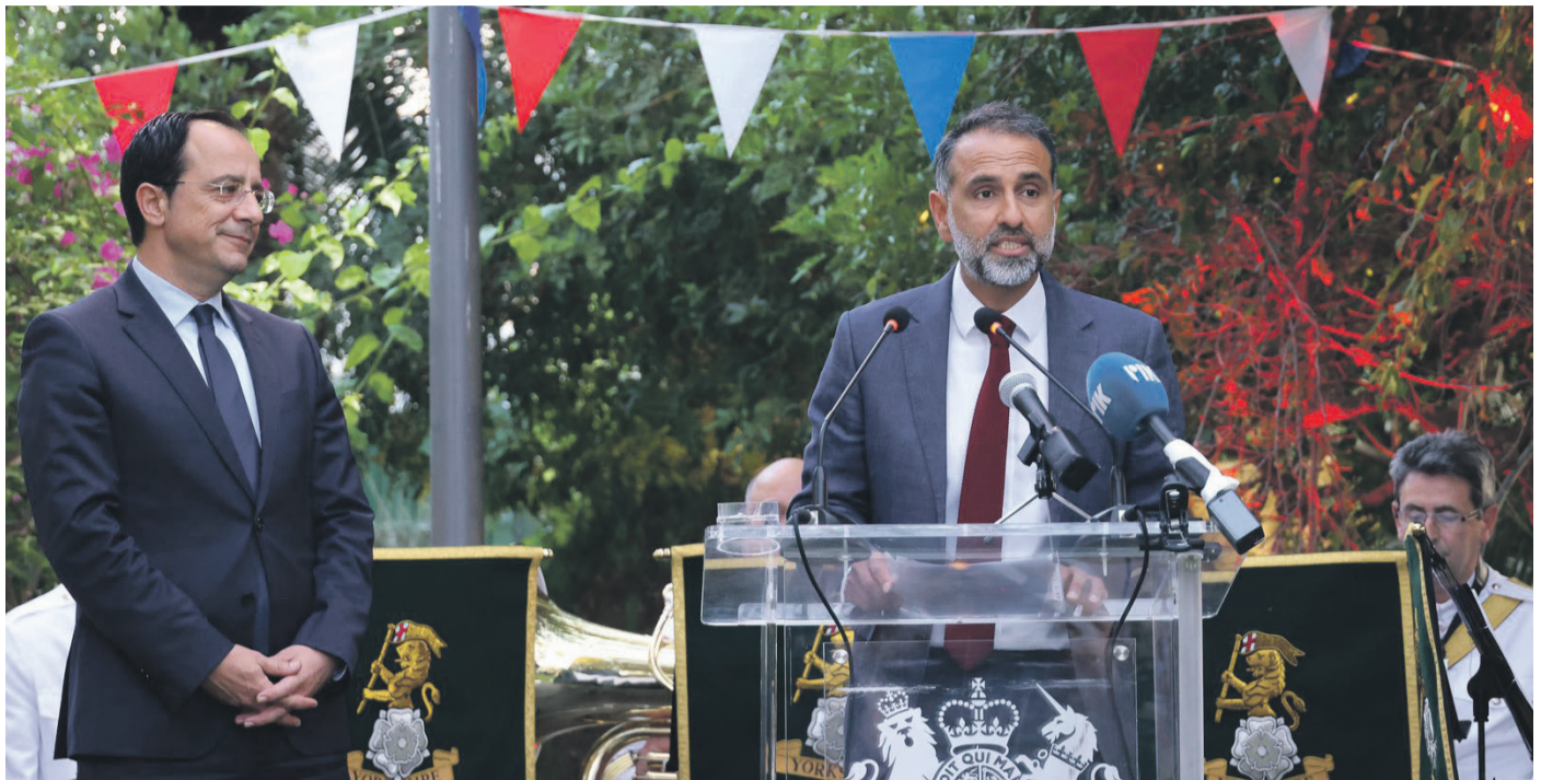
Ο Πρόεδρος Νίκος Χριστοδουλίδης και ο Βρετανός Υπάτος Αρμοστής Ιρφάν Σιντίκ σε εκδήλωση της Υπάτης Αρμοστείας, 22 Ιουνίου 2023, στη Λευκωσία.

- Ασφαλώς δεν παρεξέκλινε ούτε χιλιοστό από την εφαλτηριοποίηση του «Κεκτημένου» της ΙΣΟ-ΚΥΡΙΑΡΧΙΑΣ του 2014 ο νυν Υπάτος Αρμοστής της Βρετανίας εν Κύπρω Ιρφάν Σιντίκ, με τα όσα δήλωσε την παρελθούσα Κυριακή, 4.2.2024, στη λευκωσιάτικη έκδοση της αθηναϊκής «Καθημερινής» και τα οποία ανακοινώθηκε πως