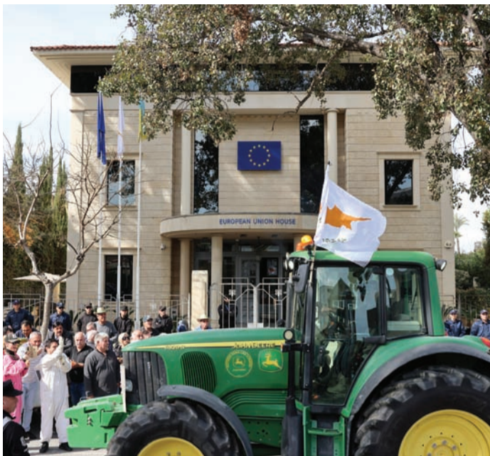
Κύπριοι αγρότες διαμαρτυρήθηκαν την Πέμπτη, 8 Φεβρουαρίου, έξω από το Σπίτι της Ευρώπης, για το κόστος παραγωγής και την επισιτιστική επάρκεια.