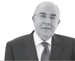
ΑΠΟΨΗ “ ΓΙΑΝΝΑΚΗΣ Λ. ΟΜΗΡΟΥ*

* Πρώην Πρόεδρος Βουλής των Αντιπροσώπων