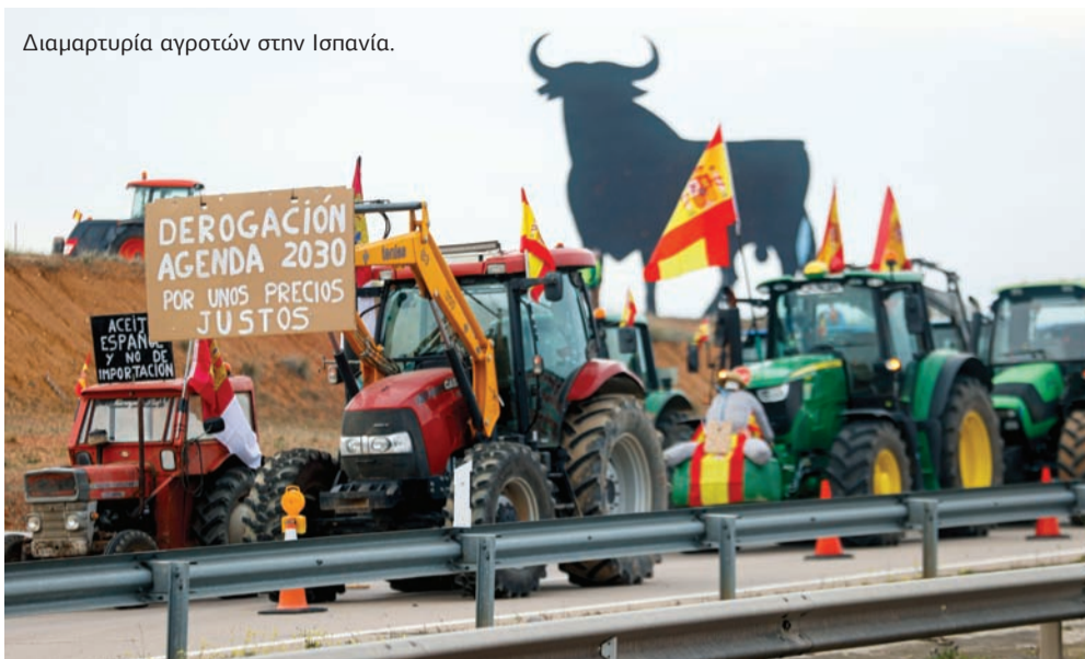
Διαμαρτυρία αγροτών στην Ισπανία.

την κατάργηση της Ευρωπαϊκής Πράσινης Συμφωνίας.