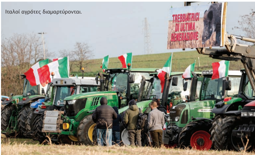
Ιταλοί αγρότες διαμαρτύρονται.

οικονομική ανάπτυξη, υψηλότερο κόστος αποπληρωμής χρέους, υψηλότερες ανάγκες στρατιωτικών δαπανών και υψηλότερες τιμές ενέργειας.