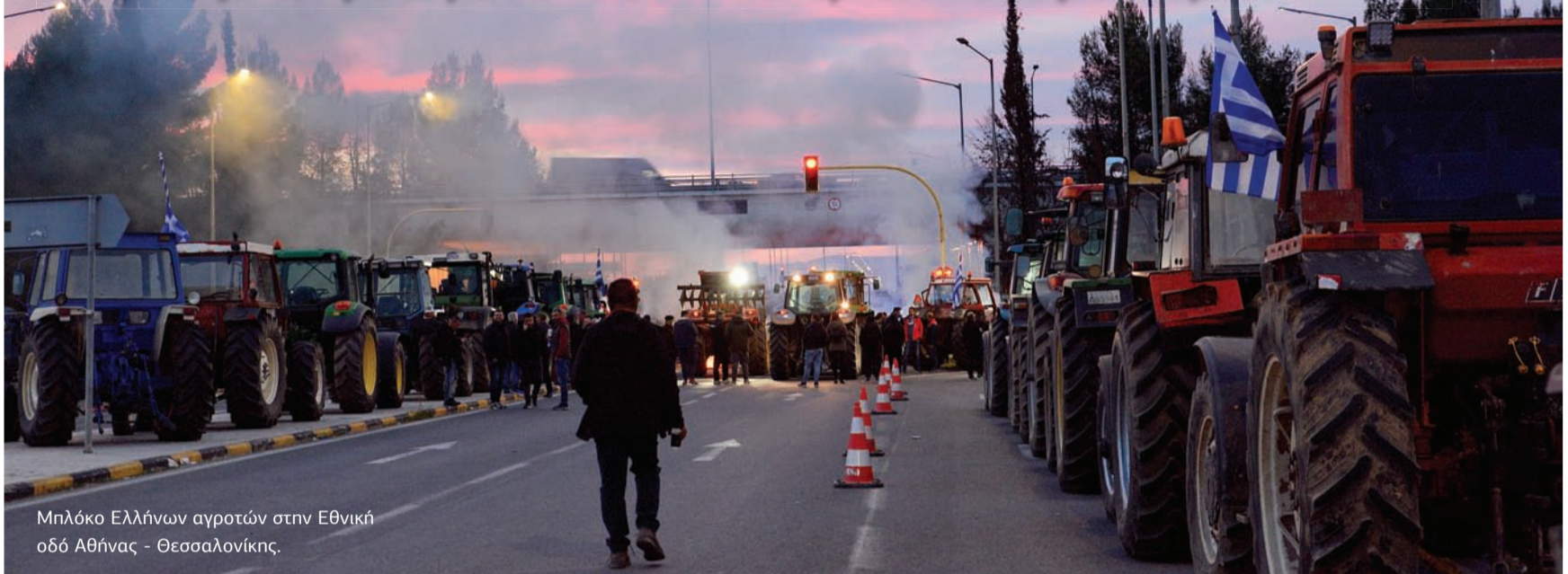
Μπλόκο Ελλήνων αγροτών στην Εθνική οδό Αθήνας - Θεσσαλονίκης.

Η Πρόεδρος της Κομισιόν με μαεστρία απέφυγε ανακοινώσεις που σχετίζονταν με το μέλλον της ΚΑΠ και αρκέστηκε σε μια «παραδοχή ήττας»