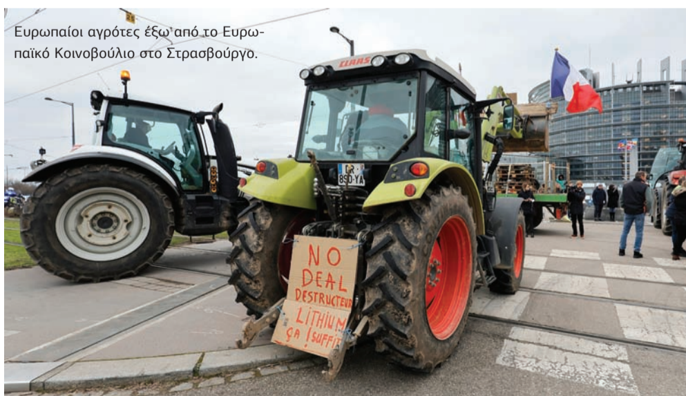
Ευρωπαίοι αγρότες έξω από το Ευρωπαϊκό Κοινοβούλιο στο Στρασβούργο.

Την ίδια ώρα, τίθεται ζήτημα αθέμιτου ανταγωνισμού και με τα ουκρανικά αγροτικά προϊόντα. Μετά την απόφαση της ΕΕ να αναστείλει τους τελωνειακούς δασμούς στις ουκρανικές εισαγωγές στις 27 χώρες της ΕΕ, δημιουργήθηκε έντονη δυσαρέσκεια στους αγρότες, οι οποίοι κατηγορούν τις Βρυξέλλες ότι με την κίνηση αυτή συνέβαλαν στην κρίση που δημιουργήθηκε στον γεωργικό τομέα. Σύμφωνα με τους αγρότες, υπάρχει μεγάλο θέμα καθώς η γεωργία της Ουκρανίας αντιπροσωπεύει το 25% της γεωργίας, κυρίως σε πουλερικά και σιτηρά, με περιβαλλοντικά πρότυπα και πρότυπα παραγωγής πολύ κάτω από τις ευρωπαϊκές πρακτικές. Σημειώνεται ότι η εξαίρεση στα ουκρανικά προϊόντα παρατάθηκε μέχρι τον Ιούνιο του 2024