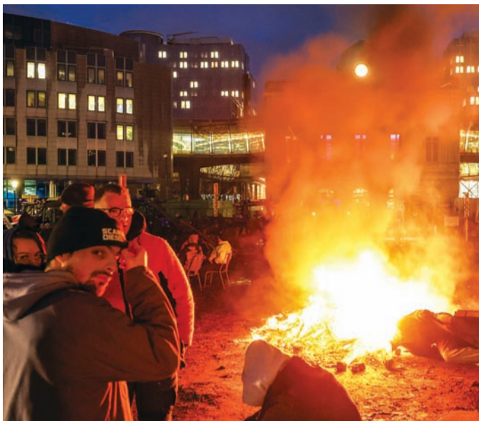
1.2.2024: Η αγανάκτηση των Ευρωπαίων αγροτών έφτασε στην καρδιά της ΕΕ. Κομβίο με εκατοντάδες οργισμένους αγρότες και τα τρακτέρ τους κατέκλυσαν τους δρόμους στις Βρυξέλλες, διεκδικώντας ένα καλύτερο γεωργικό επίπεδο πανευρωπαϊκά.