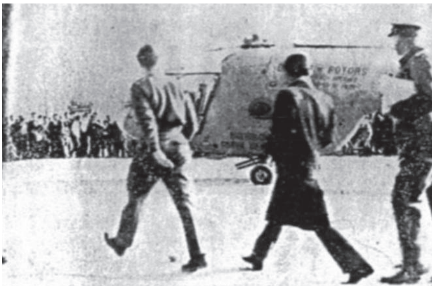
Ο Αρχιστράτηγος Peter Young, ο Captain C. Meynell και ο Τάσος Παπαδόπουλος για διαπραγματεύσεις με Έλληνες Κύπριους «μαχητές» στο Καϊμακλί (προφανώς από ελληνο-κυπριακή εφημερίδα).

Στις 14.30 οι Γλαύκος Κληρίδης και Οσμάν Ορέκ (Υπ. Αρμιοστής της ΚΔ) ξεκίνησαν διαπραγματεύσεις, με τον Υπ. Αρμιοστή και τον Πρόεδρο Μακάριο να προσέρχονται λίγο αργότερα. Καθώς προχωρούσε η συνεδρία, η ΤΟΥΡΔΥΚ βγήκε έξω από το στρατόπεδο της και κατευθύνθηκε προς το Κιόνελο στο δρόμο Κερύνειας... Αμφότεροι Μακάριος και Κουτσιούκ, ίσως με παρότρυνση από Ελλάδα και Τουρκία, ήταν έτοιμοι για ανακωχή... Αποφασίστηκε ότι τα βρετανικά, ελληνικά και τουρκικά