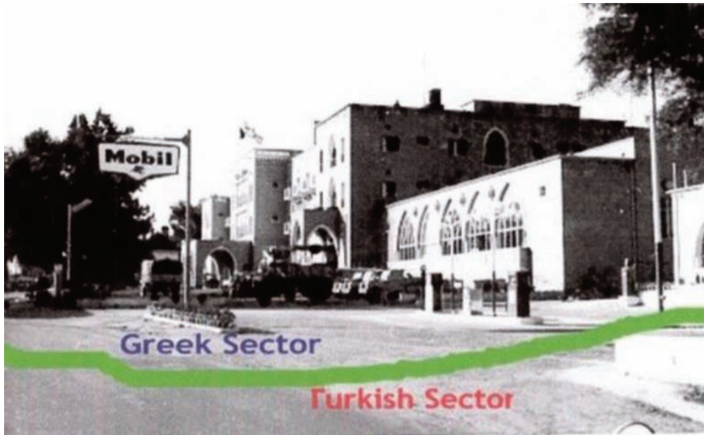
Η «Πράσινη Γραμμή» πλησίον του ξενοδοχείου Λήδρα Πάλας, όπως χαρακτήρισε από τον Αρχιστράτηγο Young, διαχωρίζοντας το έδαφος σε ελληνικό μέρος και τουρκικό μέρος.

*Οι Τ/κ ήταν οπλισμένοι και σκοτώθηκε η ιερόδουλη Τζεμαλιέ. Βλέπε άρθρο Χ. Χαραλαμπίδη, «Πράσινη Γραμμή», «Σ», 3/1/24 ( https://simerini.sigmalive.com/article/2024/1/3/prasine-