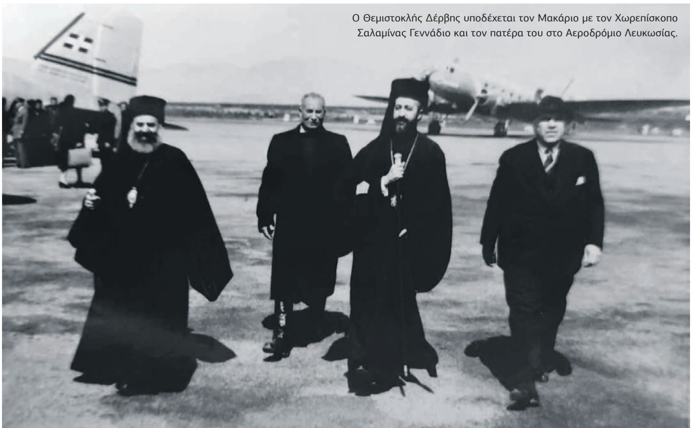
Ο Θεμιστοκλής Δέρβης υποδέχεται τον Μακάριο με τον Χωρεπίσκοπο Σαλαμίνας Γεννάδιο και τον πατέρα του στο Αεροδρόμιο Λευκωσίας.

Όταν ο Γεώργιος Παπανδρέου, επικεφαλής της Ένωσης Κέντρου, νίκησε την ΕΡΕ του Κωνσταντίνου Καραμανλή τον Νιόβη του 1963, περιέλαβε στην κυβέρνησή του και τον γιο του, Ανδρέα. Μόλις άκουσε την είδηση από το ραδιόφωνο, μπροστά στη συντακτική ομάδα της «Εθνικής», φώναξε: «Εχ...σε μέσα». Και αμ' έπος αμ' έργο, τον πήρε τηλέφωνο για να τον συγχαρεί, αλλά και να του υποδείξει ότι ήταν σφάλμα η υπουργοποίηση του Αντρέα, διότι θα έχει πρόβλημα με στελέχη του κόμματός του.