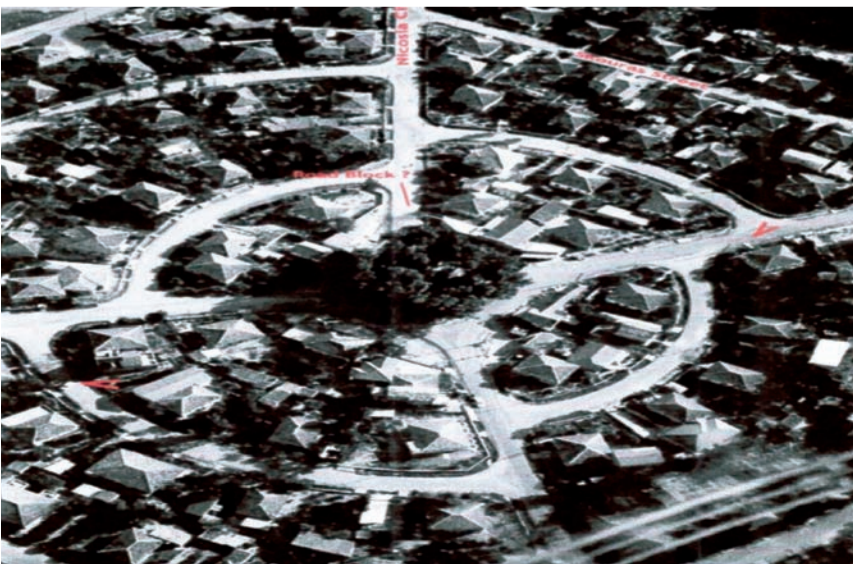
Φωτογραφία από αέρος της Νεάπολης 29 ή 30 Δεκεμβρίου 1963.

Ευχαριστώ θερμά τον Λοχαγό Christopher Meynell για την παραχώρηση των λεπτομερειών αυτών και των φωτογραφιών. Προσθέτουμε στις γνώσεις μας, για όσα γνωρίζουμε τόσο από δικές μας πηγές όσο και από τα βρετανικά έγγραφα.