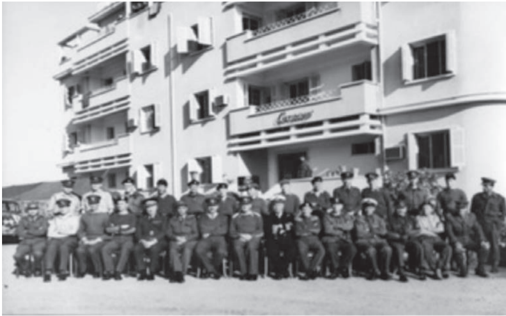
Μέλη της «Truce Force», Βρετανοί, Έλληνες και Τούρκοι στο Αρχηγείο (Ξενοδοχείο Κορνάρο).

06.30 π.μ. - Ημερία στο Γυμνάσιο Κύκκου. Στο Κιόνελλι οι Τούρκοι στα χαρακώματα βαρετά οπλισμένοι.