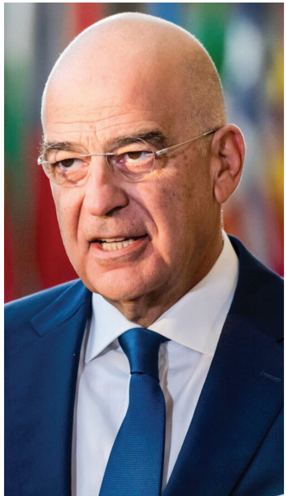
Ο ΕΛΛΗΝΑΣ ΥΠΕΣ ΝΙΚΟΣ ΔΕΝΔΙΑΣ.