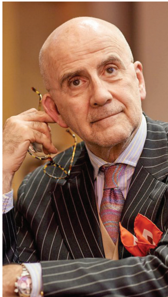
Ο ALVARO DE SOTO.