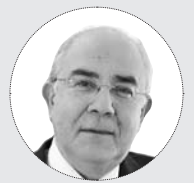
ΓΙΑΝΝΑΚΗΣ ΟΜΗΡΟΥ, Πρώην Πρόεδρος της Βουλής των Αντιπροσώπων